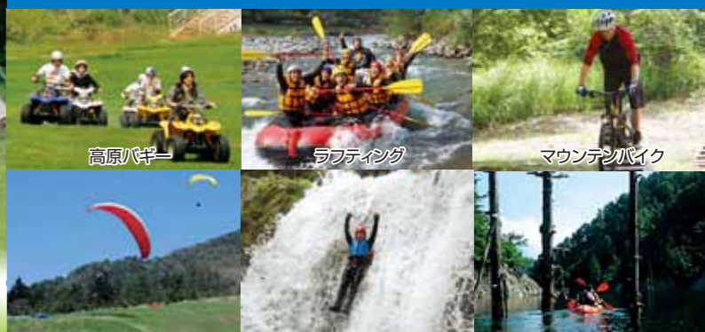
高原バギー ラフティング マウンテンバイク パラグライダー キャンيونング カヌー