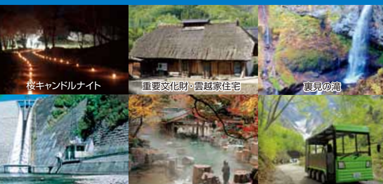
桜キャンドルナイト 重要文化財・雲越家住宅 裏見の滝 奈良俣ダム 露天風呂・宝川温泉 ※タオル付割引券あります 谷川岳一ノ倉沢電気バス ※歩行が困難な方や小さいお子様連れの方優先乗車